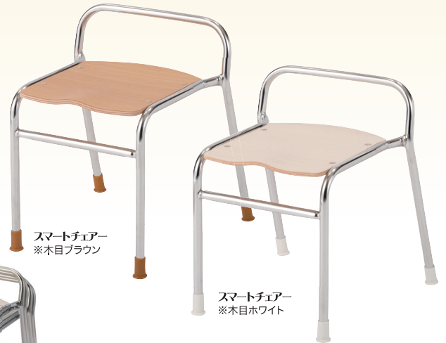
スマートチェアー ※木目ブラウン